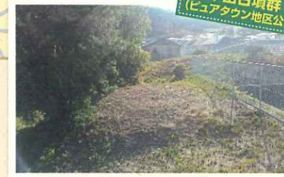
平田古墳群及びゆふけ遺跡跡から出土した土器の一部は、安濃図書館2階の安濃郷土資料館に展示されています。

平坦な道で歩きやすいコースです。大市神社は100段以上の階段がありますが、裏道は坂道となっており、足に自信のない方でも大丈夫です。