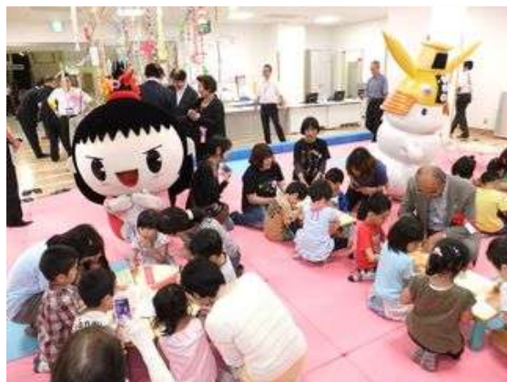
まん中こども館等の運営(まん中こども館)