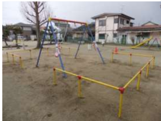
街区公園等の遊具の更新(新町公園)