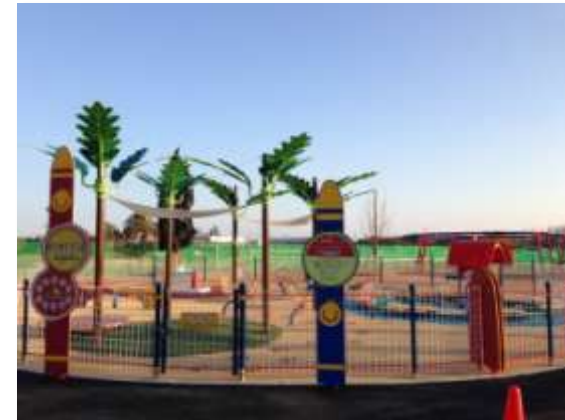
新しい複合遊具等の設置(中勢グリーンパーク)