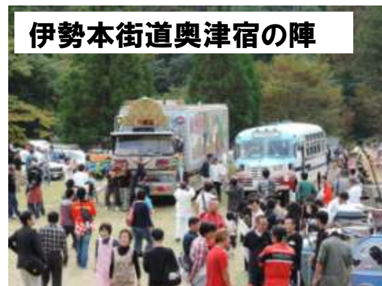
伊勢本街道奥津宿の陣