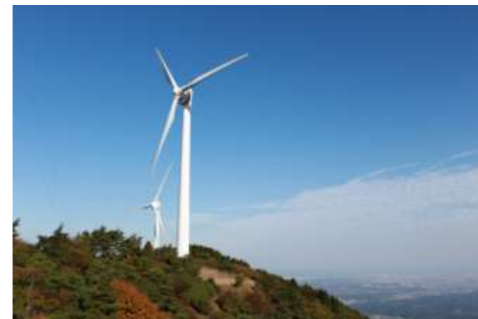
青山高原風力発電施設

バイオマス発電施設見学(JFEエンジニアリング株式会社)「建設中」、太陽光発電施設見学(伯東株式会社)、青山高原風力発電施設見学 など