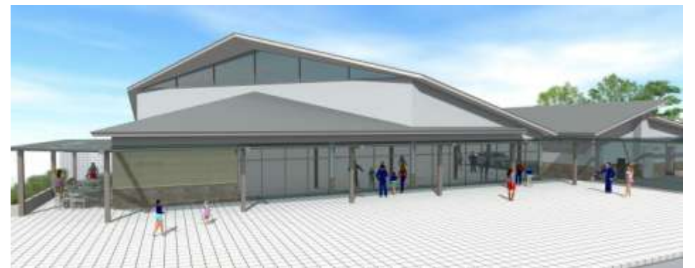
道の駅津かわげイメージ図