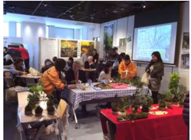
「つデイ」開催時の様子