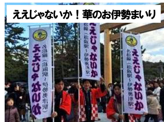
ええじゃないか！華のお伊勢まいり