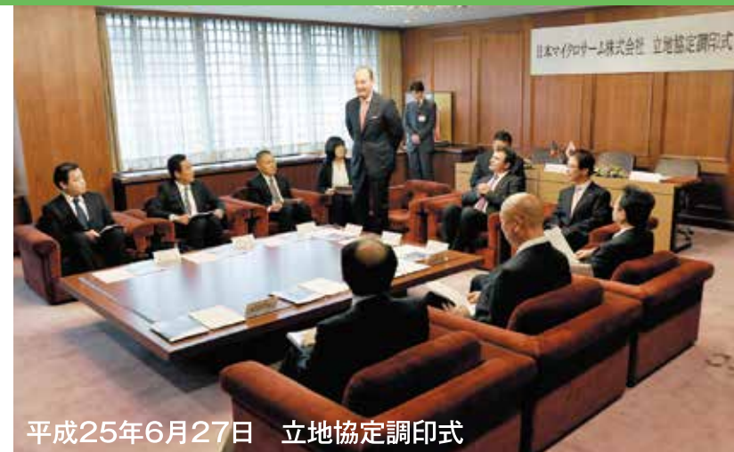
平成25年6月27日 立地協定調印式

1982年にベルギー外務省に入省。モスクワ、アンカラ、プラハに外交官として赴任、本国にて外務大臣首席補佐官代理を務めた後、駐クロアチア、ベルギー大使、駐セルビア・モンテネグロ、ベルギー大使を歴任。本国にて外務省欧州総局欧州総合政策部長、二国間経済局南東ヨーロッパ部長などを務めた後、2011年3月の震災直後に来日し、駐日ベルギー王国特命全権大使に就任。