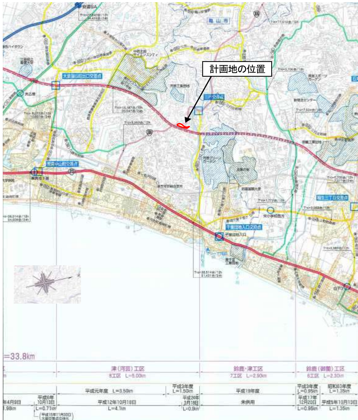
計画地の位置

計画地は、現在整備が進められている中勢バイパスに隣接し、津市河芸町三行の国道306号との交差点部分に挟まれるように位置している。