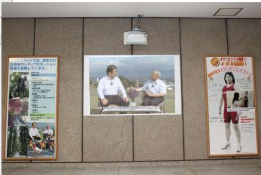
本庁舎1階ロビーに大型スクリーンを設置