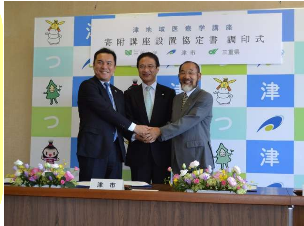
寄附講座設置協定書の調印式

白山、美杉地域等の住民や診療所医師の高齢化を踏まえた、総合診療・家庭医療などの将来的な地域医療体制の研究等。