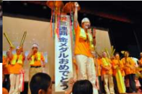
吉田沙保里選手市民応援観戦会