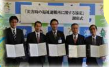
福祉避難所に関する協定調印式