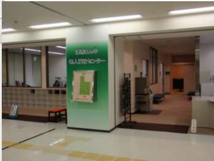
津市まん中老人福祉センター