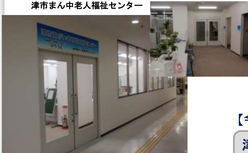
津市障がい者相談支援センター

津市丸之内老人福祉センター、津市障がい者相談支援センター（津市社会福祉センター内）を津センターパレス3階へ移転。 津市まん中老人福祉センター、津市障がい者相談支援センターとして開設。