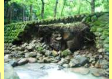
河川の護岸決壊（美杉町八知地内）