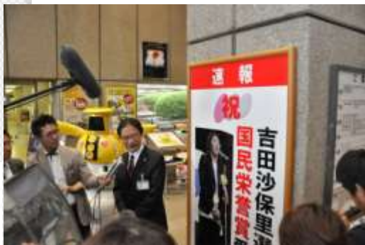
本庁舎1階ロビーにて