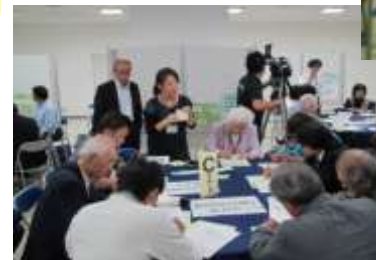
総合計画後期基本計画(案)に関するオープンディスカッション