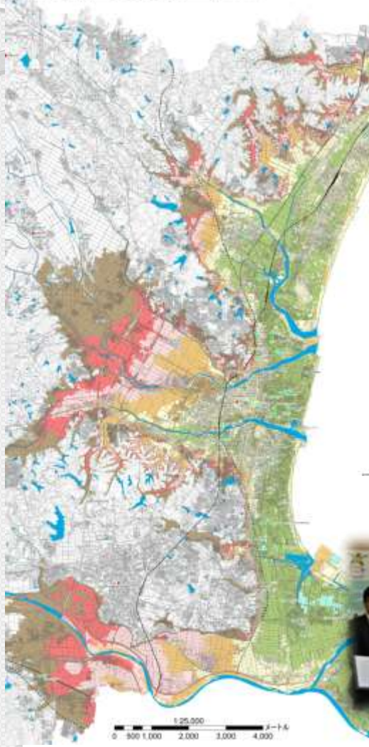
津市沿岸地域標高マップ