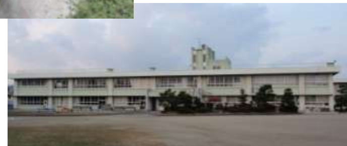
新たにスタートした芸濃小学校 (旧椋本小学校)