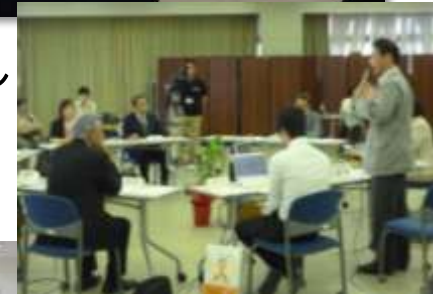
幼保一体化に係るオープンディスカッション