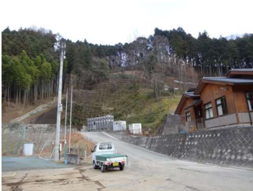
現在（平成24年12月17日撮影）