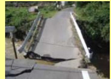
橋りょうの損壊（美里町家所地内）