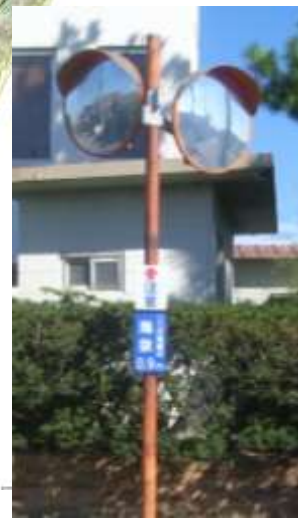
カーブミラー等への海拔表示