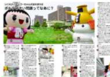
「シロモチくんとゴーちゃんが語る津市政」 (広報津：2012年6月1日号初登場)