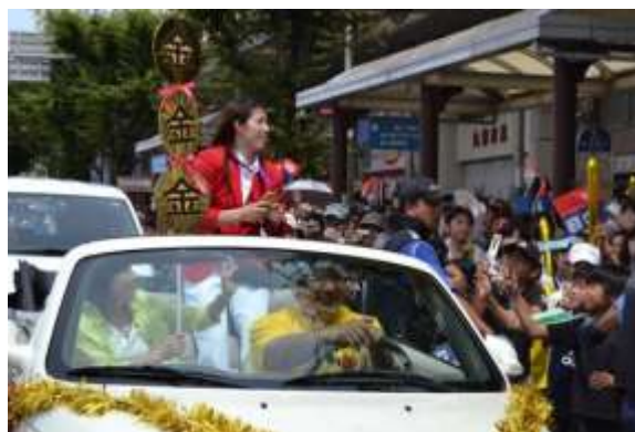
市内凱旋パレード