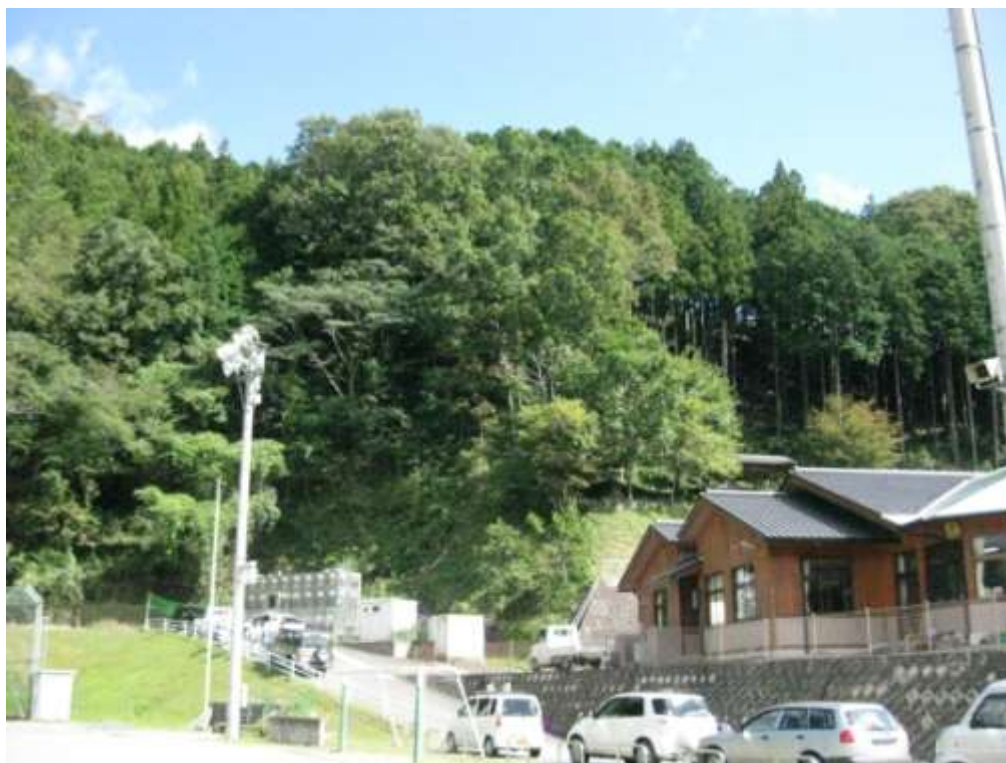
着工前（平成23年10月6日撮影）