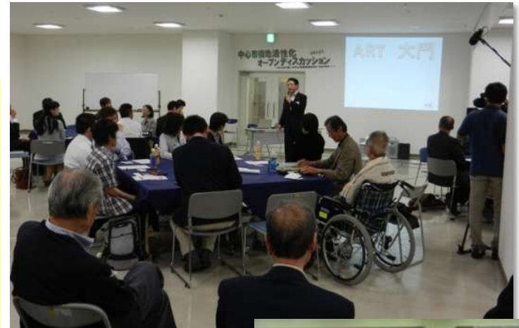
中心市街地に係るオープンディスカッション