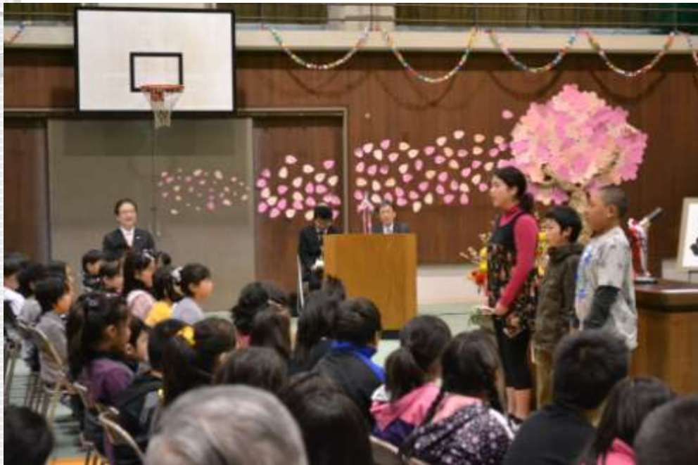
芸濃小学校の開校式

3月23日 椋本小学校閉校式 3月24日 安西小学校閉校式 3月25日 雲林院小学校閉校式 4月 1日 3校が統合 4月 6日 芸濃小学校開校式 児童数300人で新たにスタート