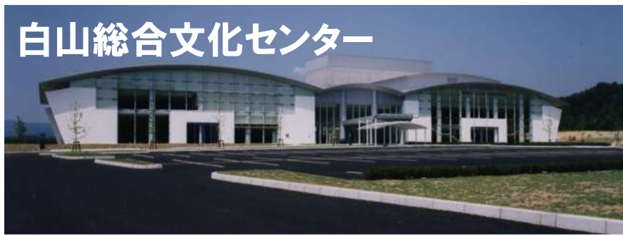
白山総合文化センター