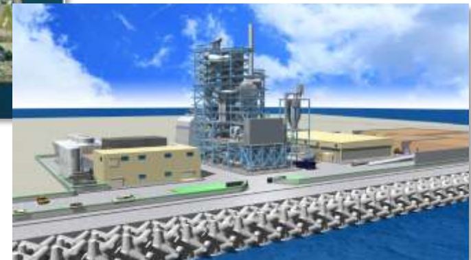
発電所完成予想図