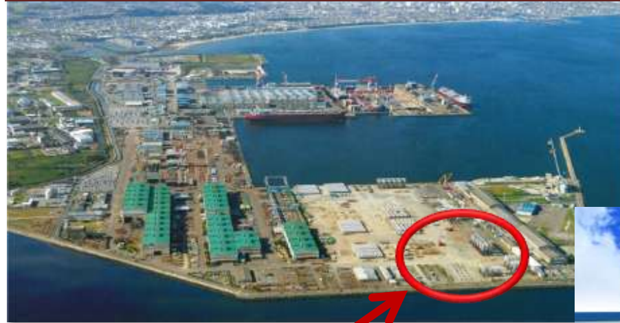
木質バイオマス発電建設地 (平成28年7月稼動予定)