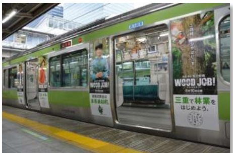
ラッピング広告(JR山手線)