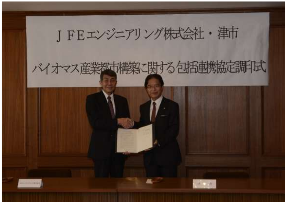
バイオマス産業都市構築に関する 包括連携協定調印式の様子

9月22日 木質バイオマス発電プロジェクトへの参画企業であるJFEエンジニアリング株式会社とバイオマス産業都市構築に関する包括連携協定を締結