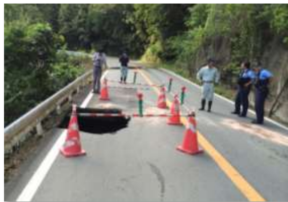
国道163号の道路陥没 (美里町北長野地内)