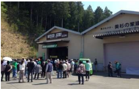
賑わう記念館の様子

映画の舞台「津市美杉」を全国にPRする シティプロモーションを展開 ▶ WOOD JOB! 神去なあなあ日常記念館の開館 (12,095人来館) ▶ ロケ地ツアーの開催 (15回実施) ▶ シティプロモーションカード(名刺)の活用 ▶ 市内公共施設等にPRコーナー開設 ▶ JR山手線へのラッピング広告 ▶ ようこそ神去村へ!&三重テラスin赤坂サカスの開催