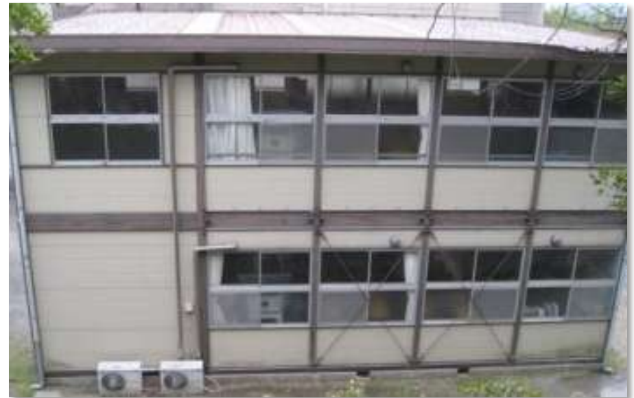
西が丘小学校プレハブ校舎