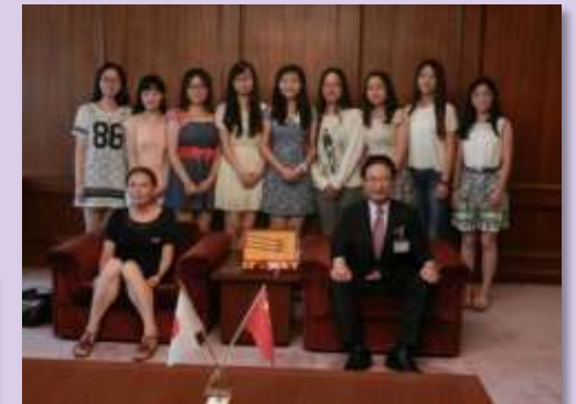
江蘇大学友好訪日団 の招へい(8月～9月)