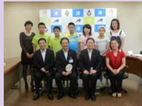
鎮江市青少年卓球 訪日団の招へい(8月)