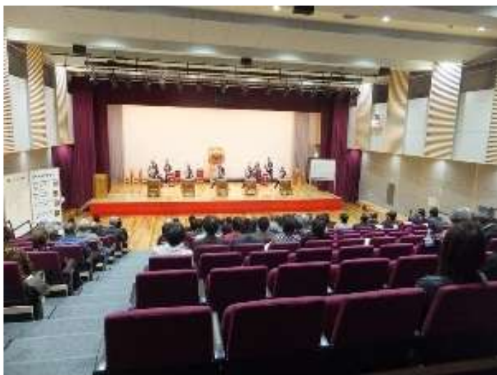
津市美杉総合文化センター 多目的ホール