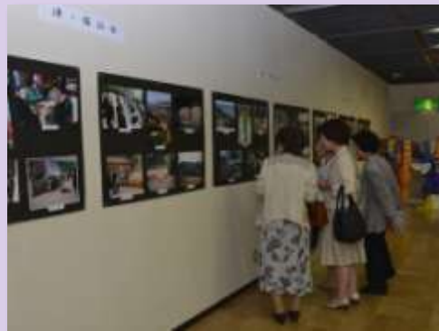
津市・鎮江市友好交流 写真書画展(6月)