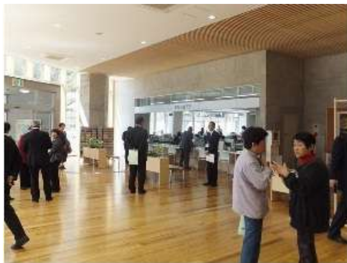
市美杉庁舎エントランスロビー