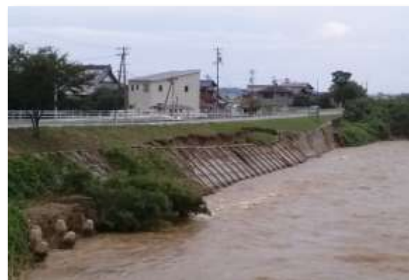
安濃川の護岸崩壊 (安濃町荒木地内)