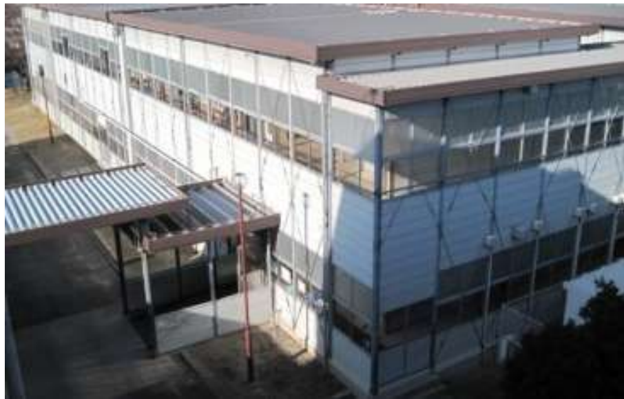
南が丘小学校プレハブ校舎

建設から10年以上が経過した南が丘小学校と西が丘小学校のプレハブ校舎を、新校舎を建設することにより解消する方針を決定