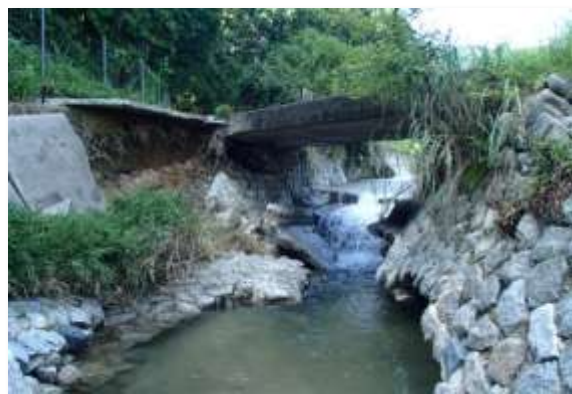
橋りょうの損壊 (美里町穴倉地内)

災害復旧事業箇所 1,610カ所 災害復旧事業費見込額 約31億8,000万円 (平成26年11月30日現在)