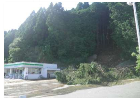
山腹の崩壊 (白山町垣内地内)