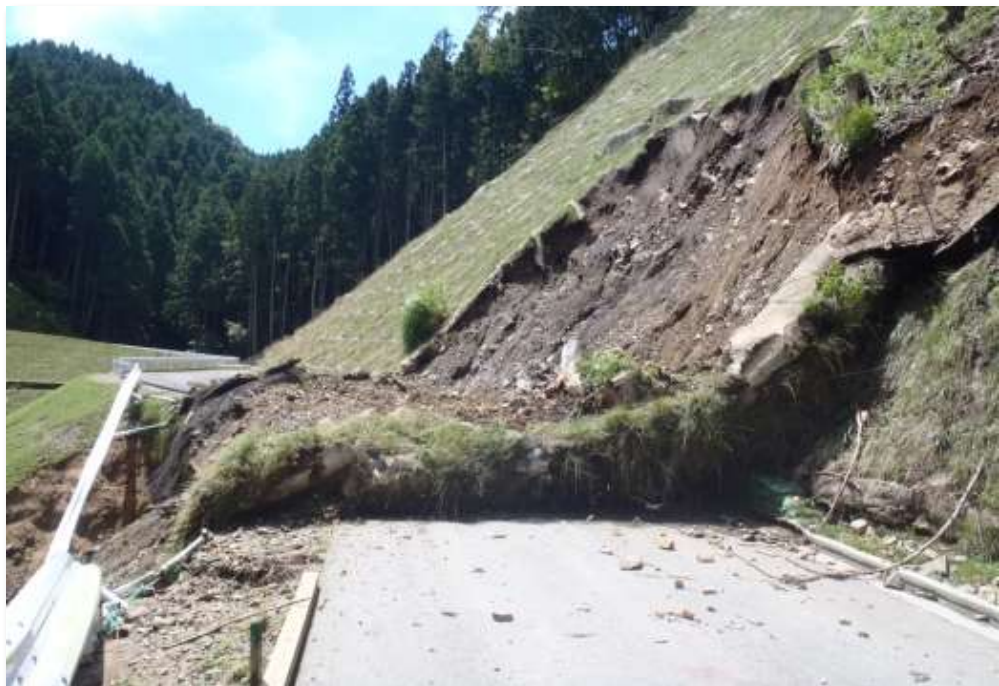
林道の法面・路側崩壊(芸濃町河内地内)

台風第11号が8月9日から10日にかけて襲来。県内初の大雨特別警報が発表され、市内に甚大な被害をもたらし、国が激甚災害に指定