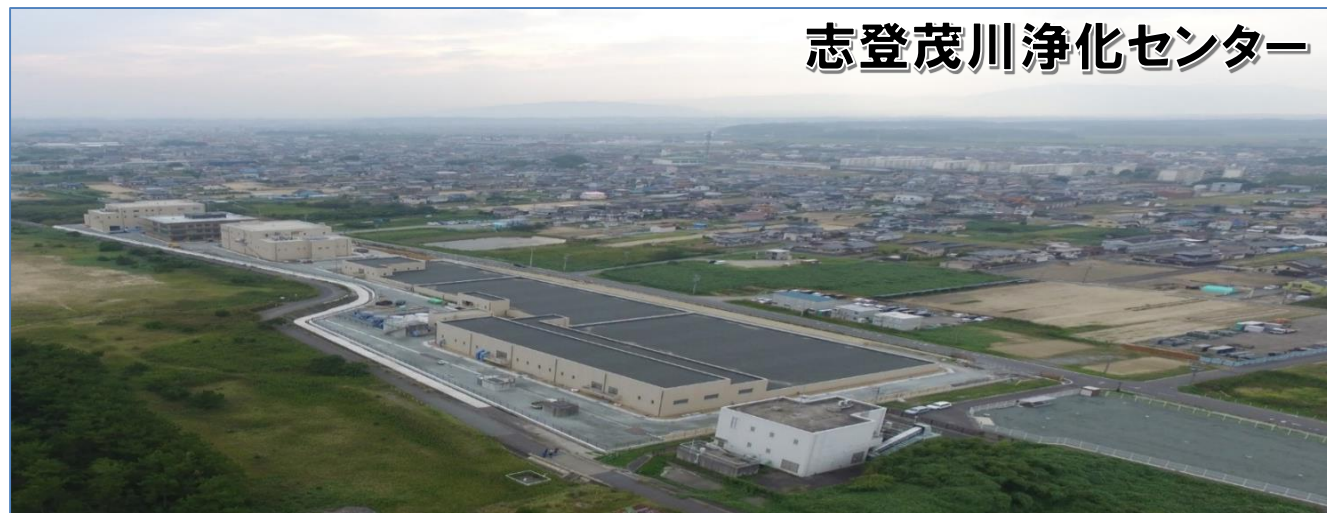
志登茂川浄化センター

4月から津(北部)地域・ 河芸地域・安濃地域の一部で 公共下水道の処理が始まり、 既に約6,000人が使用