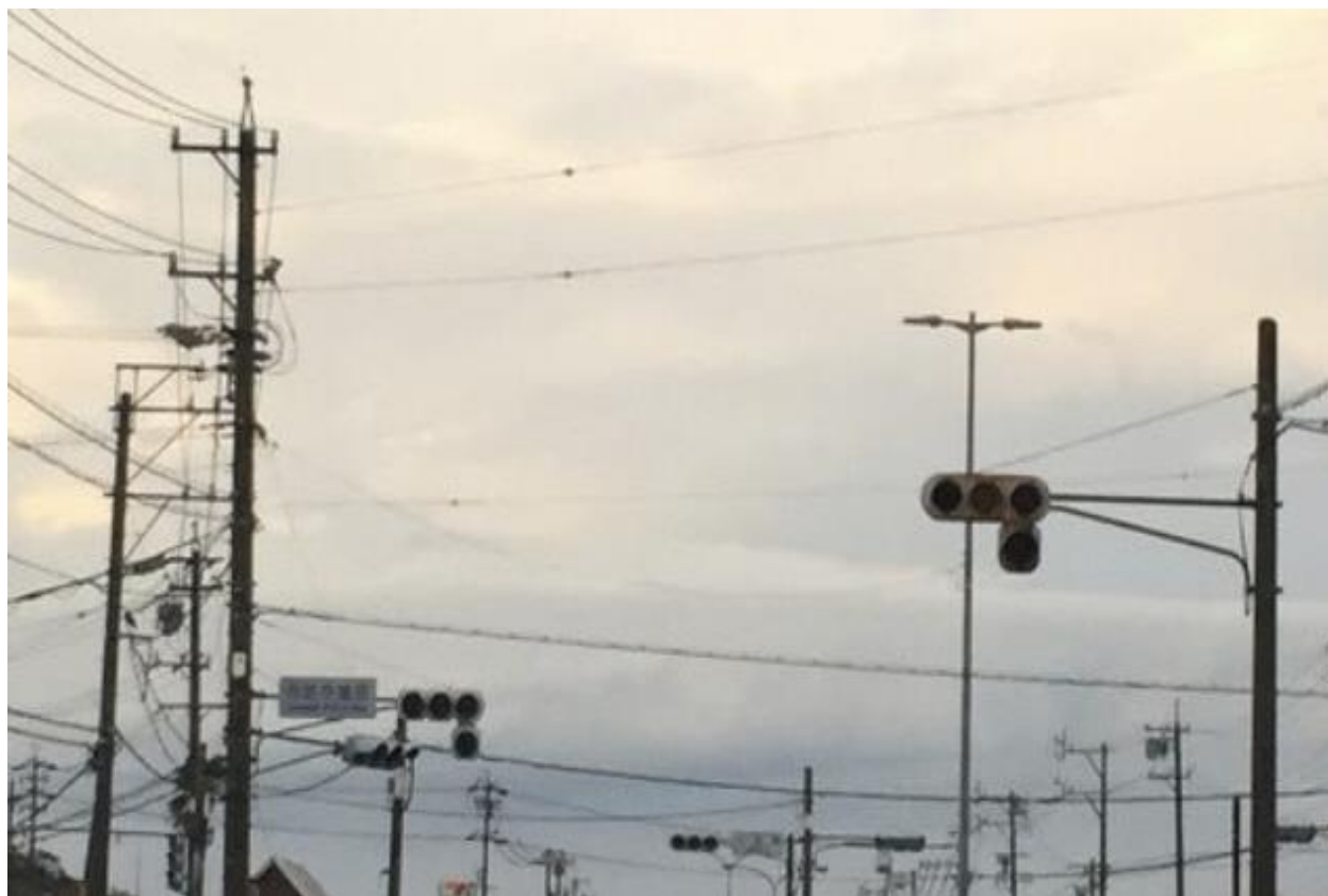
台風第21号により停電した市内の信号機