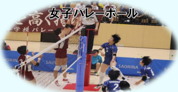
女子バレーボール