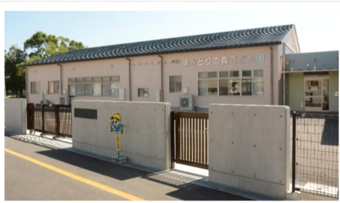
津みどりの森こども園