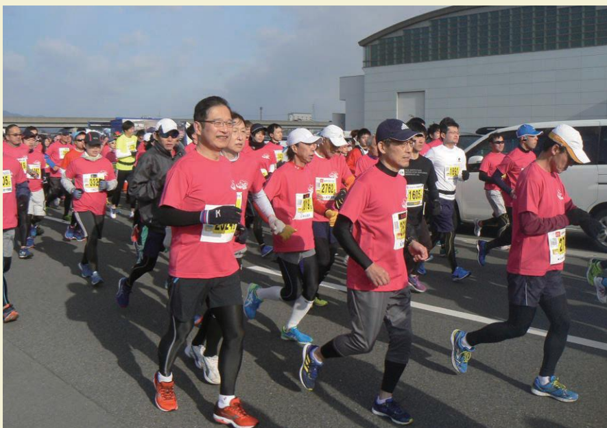
市民ランナーと「津シティマラソン」10kmを完走

何より大きく変わったのが食です。朝出勤するなりコーヒーパー手に話し始めるフランス人たちは食に一切の妥協がありません。料理の食材から調理法に至るまで広く深い知識を持ち、ディナーはもちろん、毎日のランチも店やメニューに大いにこだわ