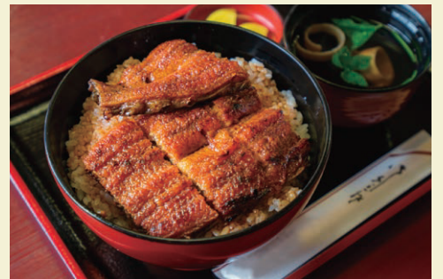
ウナギの一大供給地だった津では、今も専門店が多い

秋のリーマンショックです。世界金融市場の混乱により、デクシア銀行は日本市場からの撤退を決定。手に職を持つ専門家集団は次々と転職を決め、私も、資産売却にめどを付け、日本の金融機関に移りました。 2011年、49歳の春、統一地方選挙に挑戦する機会をいただき、ふるさと津市の市長に就任しました。首長職に欠かせない気力・体力・コミュニケーション力を維持するためにも週2回出勤前のジム通いと英会話番組の視聴を欠かさず、食いしん坊のフランス人たちとの交流で高まった食への興味も相まって、地元津市の食の探訪と魅力の再発見に心躍らせる日々です。