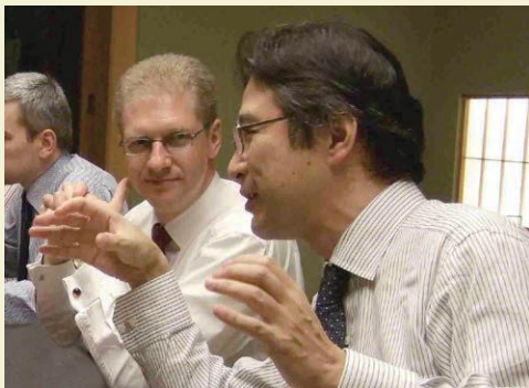
デクシア銀行東京支店副支店長の頃の筆者