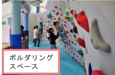
ボルダリング スペース