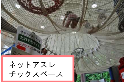
ネットアスレ チックスペース