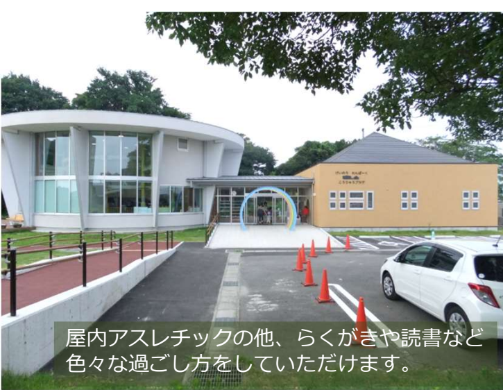
屋内アスレチックの他、らくがきや読書など 色々な過ごし方をいただけます。