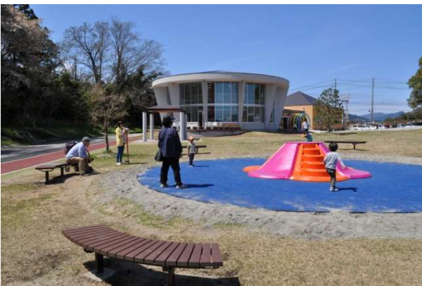
天気の良い日は屋外で思いっきり遊ぼう