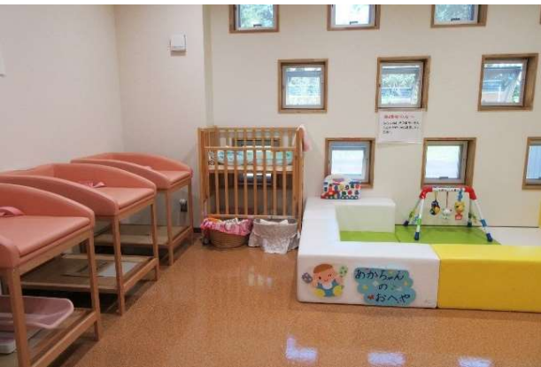
赤ちゃんにやさしい設備を完備