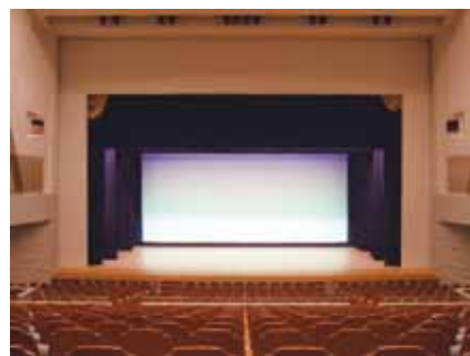
ハーモニーホール