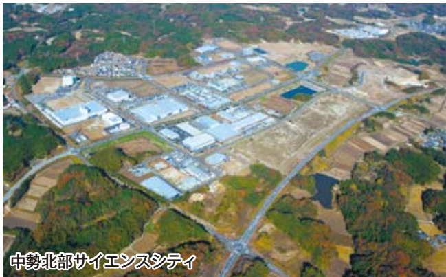
中勢北部サイエンスシティ

中勢北部サイエンスシティは、これまでの工業団地のコンセプトに加え、先端的産業の研究開発から生産、物流の一貫した産業活動を可能とし、かつ職住近接、企業間の交流、身近なスポーツ・レクリエーションなど多様な機能が一体となった中部圏最大規模の複合的産業団地として、潤いある魅力的な都市空間を生み出しています。