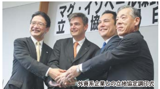
外資系企業との立地協定調印式

これらの取り組みは、着実に成果をあげ、昨年一年間だけでも、8社の企業誘致に成功しています。また、誘致企業も世界的な規模で新たな事業を展開する企業や、外資系企業の立地が決定するなど、国内企業にとどまらず、幅広い分野に大きな広がりを見せています。