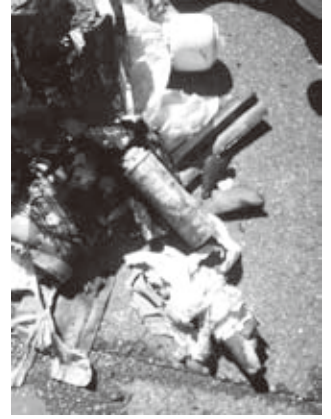
混入していたスプレー缶