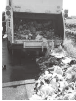
9月26日に発生したごみ収集車の火災

このようなことを未然に防ぐために、火災発生原因となる物をごみ集積所に出すときは、次のような処理をしてから出してください。