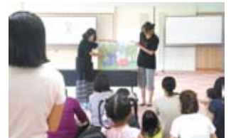
大型絵本の読み聞かせ

保育所に併設の12カ所と地域独立型の2カ所(芸濃・安濃)の子育て支援センターがあり、地域のさまざまな世代や立場の人が子どもや子育て家庭に関心を持って関わることで、地域全体で子育てを育む仕組みづくりを行っています。