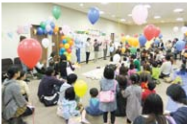
ふれあいワクワクステージ

毎年開催している元気っ津まつりでは、子育て支援の場づくり、子育て・子育て団体のネットワークづくりを行っています。