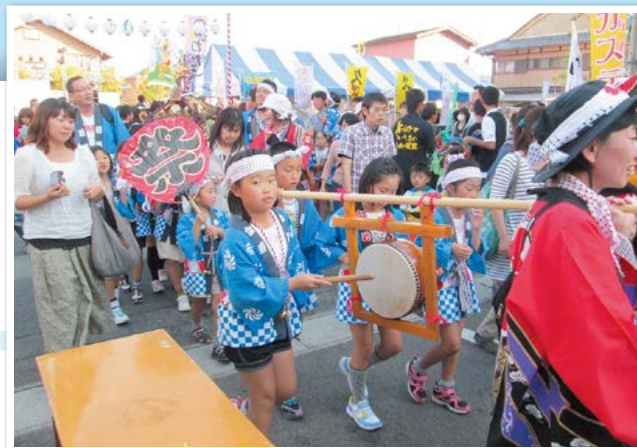
昨年の久居まつり久居彩祭

今後も獅子舞の復活などの新企画を計画し、新たなメンバーの活躍の機会を増やして、次世代にバトンをつなげていきたいと意気込みを語ります。