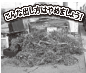
ひもで縛らずに出された枝類

A 3 枝類は長さ1 m、太さ5 cm以内に切り、ひもなどで縛ってください。草や葉は風で飛ばないように透明か半透明の袋に入れてごみ一時集積所に出してください。