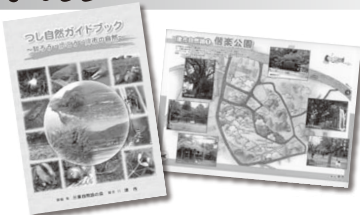
つし自然ガイドブックとハンドマップ