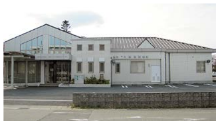
津市休日応急・夜間こども応急クリニック