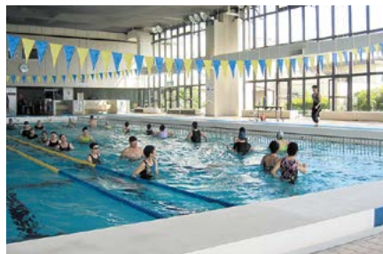
アクアフィットネス教室