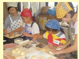
親子で楽しくパン作り

締め切り 7月9日(水)必着 ※1人1教室のみで複数申し込みは無効。ただし、第2希望があれば明記。はがき1枚につき1人(組)の応募