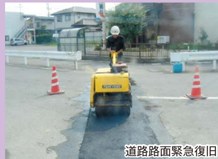
道路路面緊急復旧