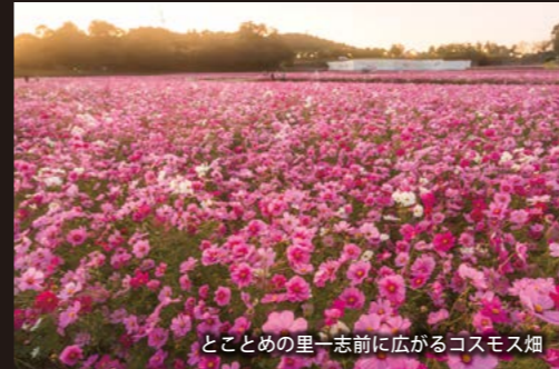
とことめの里一志前に広がるコスモス畑