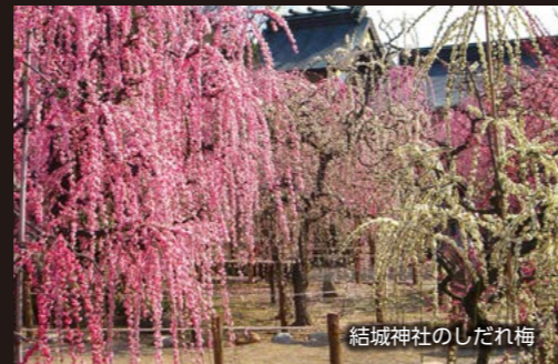
結城神社のしだれ梅