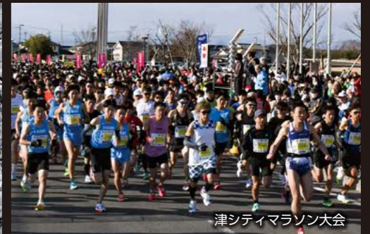
津シティマラソン大会