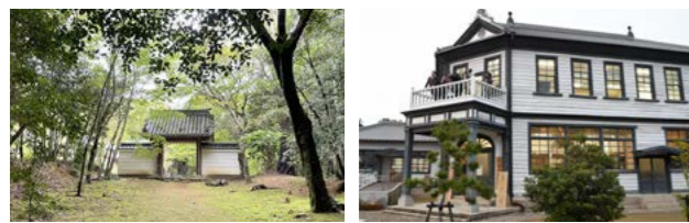
上 国宝建造物2棟と重要文化財11棟を有する高田本山専修寺 左下 木々に囲まれた趣深い山寺・円光寺。山を切り拓いて続く参道は圧巻 右下 大正5年に建設されたバルコニー付き洋風デザインの旧明村役場庁舎