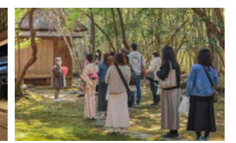
ロケ地ツアーの様子