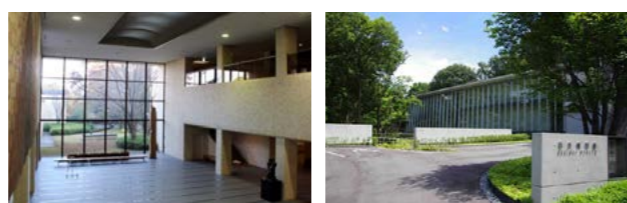
上 キャンパス内にレーモンドホールなど貴重な古建築を有する三重大学 左下 広々としたエントランスホールや屋外広場のある県立美術館 右下 千歳山の森の中にたたずむ石水博物館