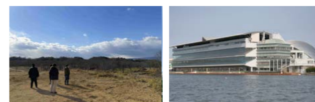
上 レトロな雰囲気がロケ隊に人気の大門商店街 左下 見渡す限りの荒野が広がる陸上自衛隊久居演習場(通常非公開) 右下 近未来建築物にも大型商業施設にも見えるポートレース津