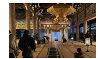
国宝・御影堂内での撮影は初

2023年に公開された映画『わたしの幸せな結婚』『レジェンド&バタフライ』は、いずれも高田本山専修寺で撮影されました。専修寺の全面協力により、県内初の国宝建造物に指定された御影堂や、重要文化財の中にセットを組み撮影を実施。作品公開後は、多くのファンが聖地巡礼に訪れるようになりました。