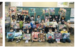
小学校での出前授業