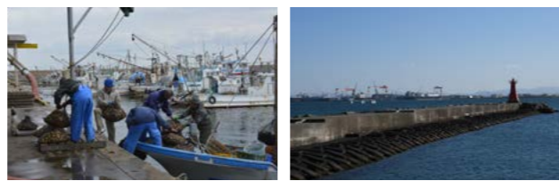
上 ヤシの木に囲まれ、南国の雰囲気漂うマリナーナ河芸 左下 風情ある港の風景が撮影できる津漁港や白塚漁港 右下 対岸に迫力ある造船所を望む御殿場海岸