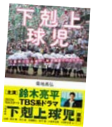
書籍『下剋上球児』(菊地高弘/カンゼン刊)

2018年、津市白山町にある県立白山高校野球部が甲子園初出場を果たしました。弱小校が起こした快進撃は「日本一の下剋上」と呼ばれ全国が熱狂。この物語をノンフィクションでつづった書籍にインスピレーションを受けて作られたドラマが2023年に放送され、地元が盛り上がりました。