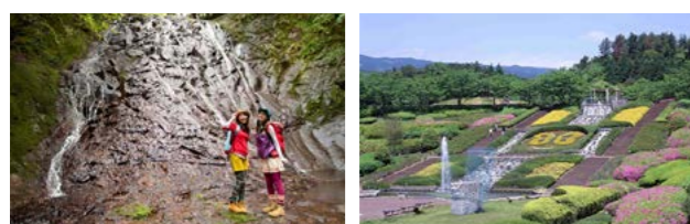
上 山々と渓谷、田園を走る電車のハーモニーが見られる家城ライン周辺 左下 こけむした石畳や大小いくつもの滝がある森林セラピー基地 右下 広大な敷地に芝生公園や森林が広がる東青山四季のさと