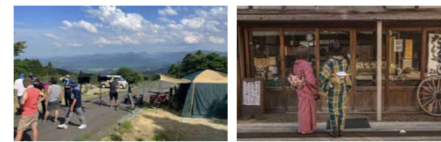
上 アスト津から望む津の街並み 左下 メタセコイヤの木が並ぶ道や見晴らしの良いキャンプ場が映える青山高原 右下 昔ながらの街並みに環濠が残る一身田寺内町