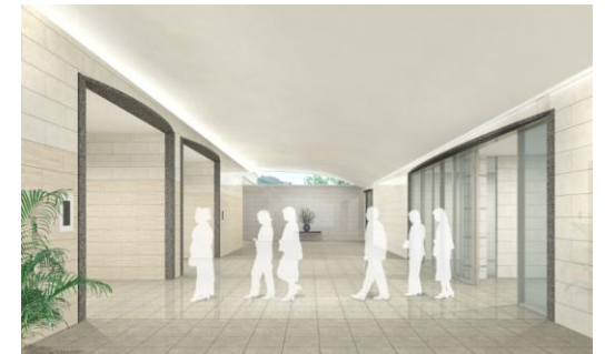
【エントランスホール】