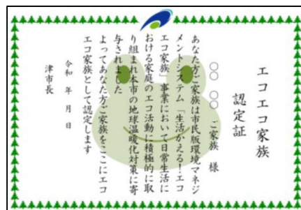
エコエコ家族認定証