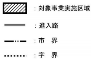
图 6-1 関係地域位置图