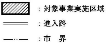
图 1.7-1 対象事業実施区域位置图