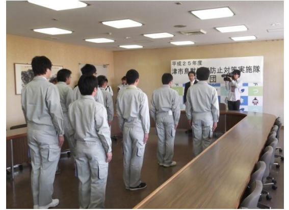
結団式の様子 (平成25年4月18日実施)

結団式では隊長を始めとした9名の隊員が任務の重要性を再認識し、鳥獣被害防止への決意を新たにしました。