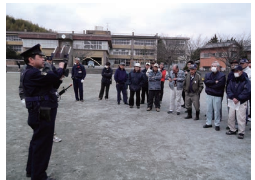
追い払い器具講習会の様子

より安全で効率的な追い払いを行うために、追い払い道具取り扱い講習会を開催しています。講習には花火メーカーの社員や警察官、県の普及員など多彩な講師を招き、好評を得ています。