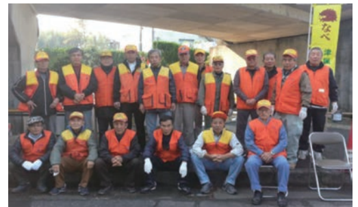
(一社)三重県猟友会津支部のみなさん

この取り組みの一環として、(一社)三重県猟友会に野生鳥獣の捕獲を委託しています。この他、有害鳥獣捕獲用檻の購入や製作に掛かる費用を補助しています。