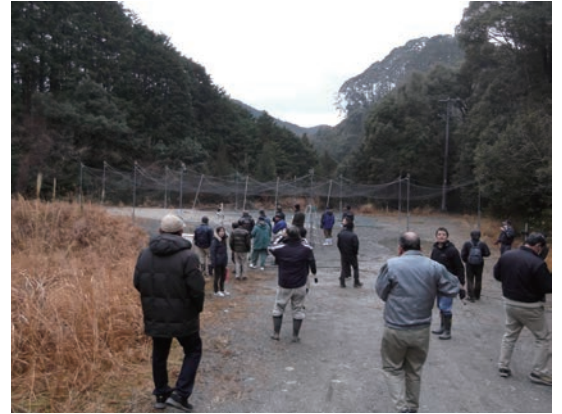
ドロップネットの視察風景

関係機関が行う研修会等への参加、先進地の視察、広域協議会主催の研修会等で、獣害対策における先進地の取り組み内容などの情報を共有し、お互いに刺激し合い「自分の地域は自分達で守る」という意識の醸成に努めています。