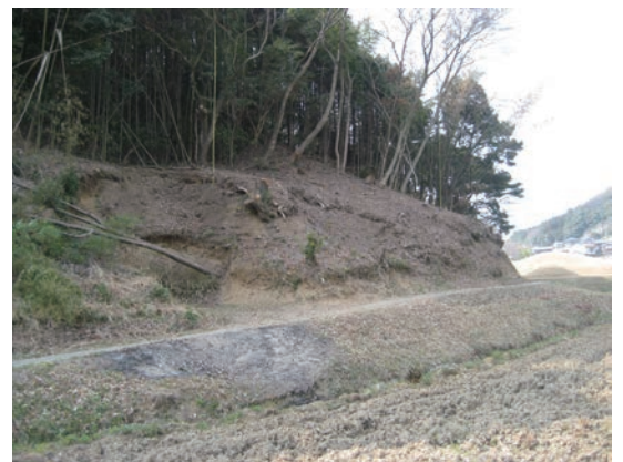
緩衝帯の整備は各地の協議会で行われている

例えば、水路等からの侵入防止柵、防護柵設置後の獣の遊動域調査、多獣種柵や緩衝帯整備などを行っています。