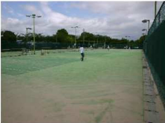
津市久居スポーツ公園内テニスコート 久居野村町877-1