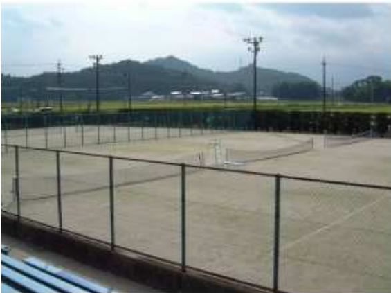
津市一志テニスコート 一志町井生2858