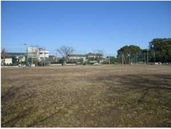
津市乙部公園内運動広場 寿町5