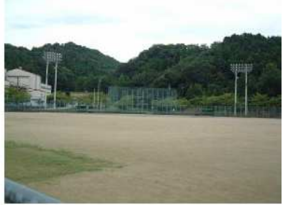
津市白山運動場 白山町古市699