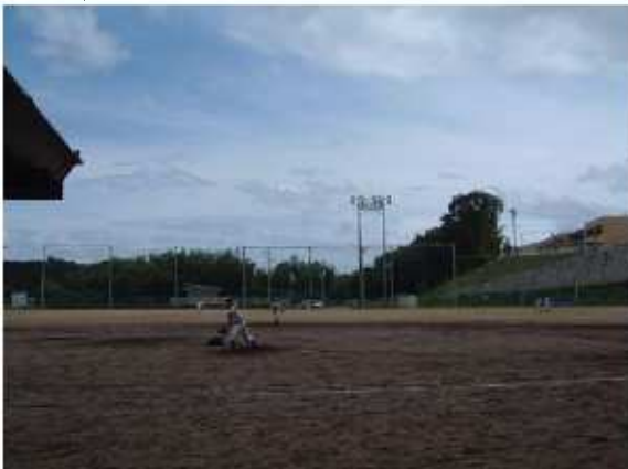
津市美里グラウンド 美里町三郷70