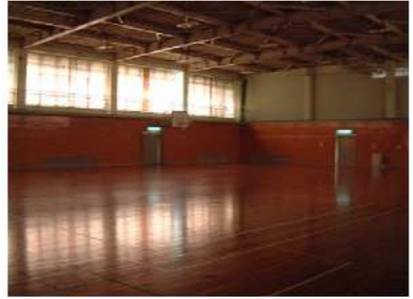
津市安濃中央総合公園内体育館 安濃町田端上野818