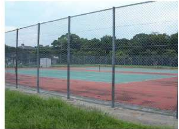
津市香良洲テニスコート 香良洲町3675-16