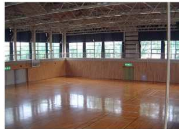
津市芸濃総合文化センター内アリーナ 芸濃町椋本6824