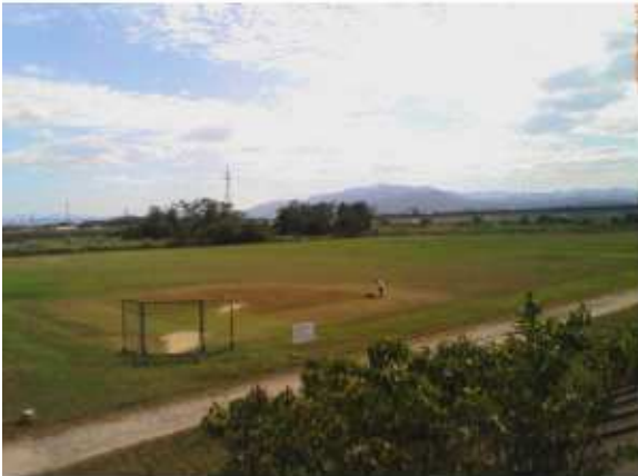
津市雲出川緑地内ソフトボール場 牧町569