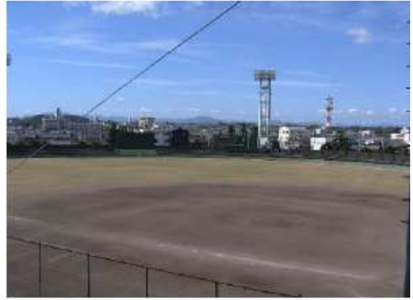
津市安濃中央総合公園内野球場 安濃町田端上野1041