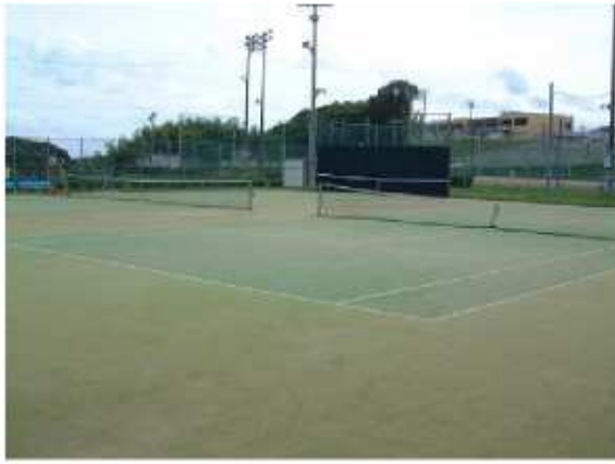
津市美里テニスコート 美里町三郷54