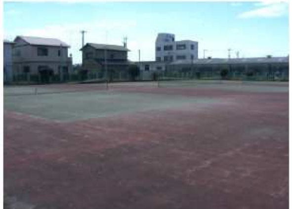
津市海浜公園内テニスコート 未広町24-32