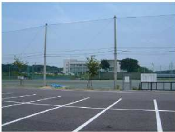
津市河芸第2グラウンド 河芸町浜田793