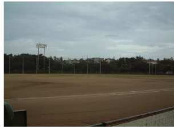
津市芸濃グラウンド 芸濃町林1899