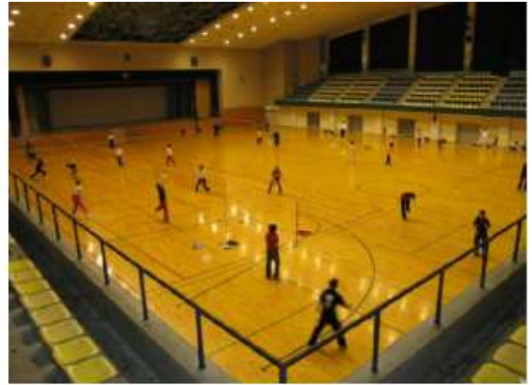
津市久居体育館 久居野村町877-1