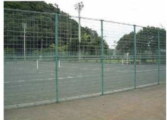
津市白山テニスコート 白山町古市715