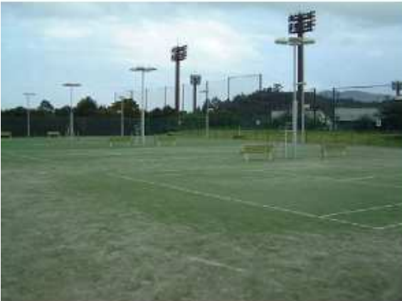
津市安濃中央総合公園内テニスコート 安濃町田端上野1023-1