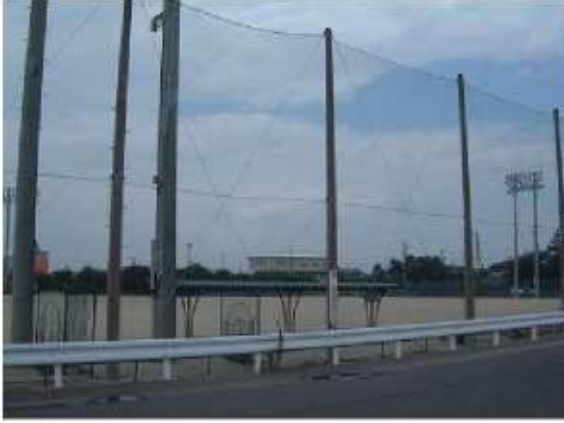
津市香良洲グラウンド 香良洲町3675-16