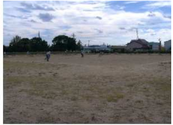
津市南部緑地公園内運動広場 高茶屋小森町4000