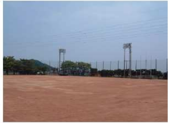
津市河芸第1グラウンド 河芸町浜田742