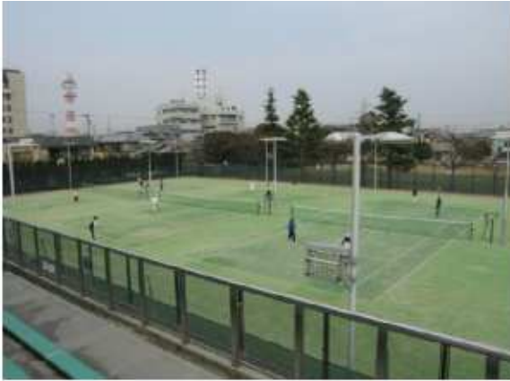
津市古道公園内テニスコート 南中央3-1