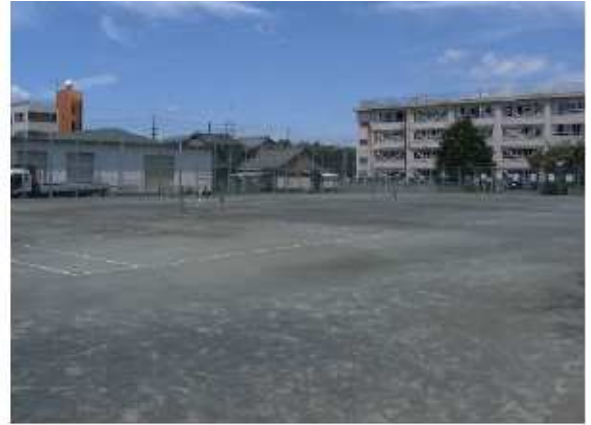
津市古河公園内テニスコート 東古河町5