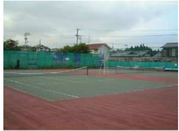
津市安濃テニスコート 安濃町田端上野897