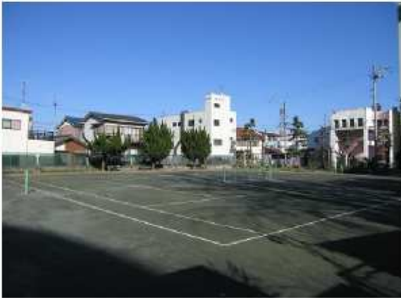
津市入江公園内テニスコート 大門5-2