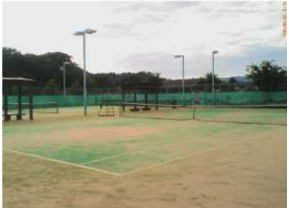
津市庄司庵公園内テニスコート 森町1-1