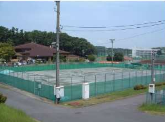
津市河芸テニスコート 河芸町浜田767