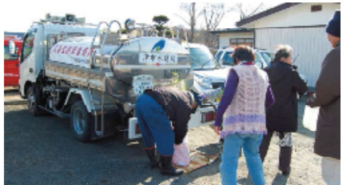
東日本大震災の被災地で行った給水活動

これまでの地震災害状況からも、各地の水道局からの応援による避難所などへの給水活動ができるようになるまでは、地震発生から3日程度かかるといわれています。