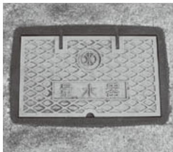
水道メーターボックスの一例