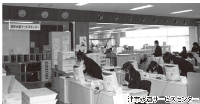
津市水道サービスセンター

水道局と受託業者が個人情報の取り扱いの重要性を十分認識し、保護対策に万全を期します。