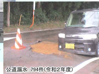
公道漏水:794件(令和2年度)

これからもより一層、経営努力を行いながら、安全・安心な水道水の安定供給に努めていきます。