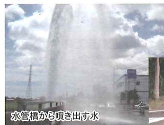
水管橋から噴き出す水

そうなんだ。だから、老朽管の更新や水道施設の耐震化など、津市の水道を将来にわたって維持していくために必要な事業を進めていくんだよ。