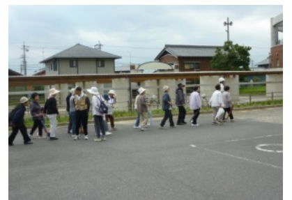
↑徒歩で避難する住民