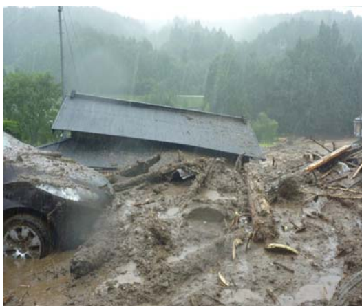
↑ 土石流による被害状況

特に紀伊半島では、総降水量が広い範囲で千ミリメートルを超える記録的な大雨となり、土砂災害、浸水、河川の氾濫等により、多数の死者、行方不明者が発生するなど、甚大な被害が発生しました。