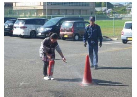
↑水消火器による消火訓練を行う実習生