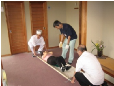
↑人がタンカで搬送する従業員