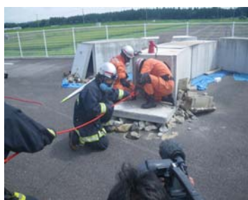
↑ がれきの中から要救助者を救出する隊員