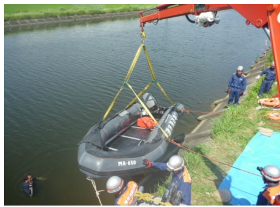
↑移動式クレーンで救助ボートを進水させる隊員

今回の訓練は、消防技能官でもある黒川北消防署副署長から、移動式クレーンを使用して救助ボートを進水させる方法、川の流れに逆っての救助ボートの手漕ぎの方法、おぼれた人を救助ボートに引き揚げる方法、救助用の浮環(浮輪)をおぼれた人に投げる方