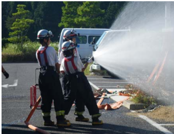
↑協力して放水する中学生

残暑厳しい中での訓練でしたが、各グループともに大粒の汗を流しながら、一致団結して指導を受けていました。