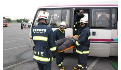
↑マイクロバスから負傷者を救出する隊員