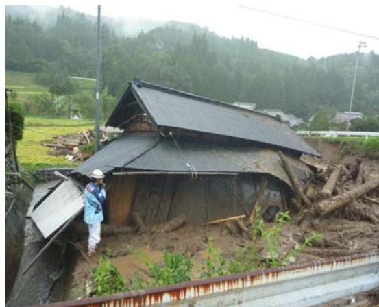
↑ 家屋の被害状況を確認する消防職員