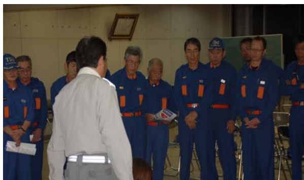
↑ 熱心に説明を聞く津方面団員

今回の普通救命講習は、AED（自動体外式除細動器）の急速な普及に伴い、地域防災の要である消防団員に、AEDの取り扱いの習熟、迅速・的確な救命活動の実施及び地域住民に対する指導技術の向上を目的として、津方面団が開催したものです。