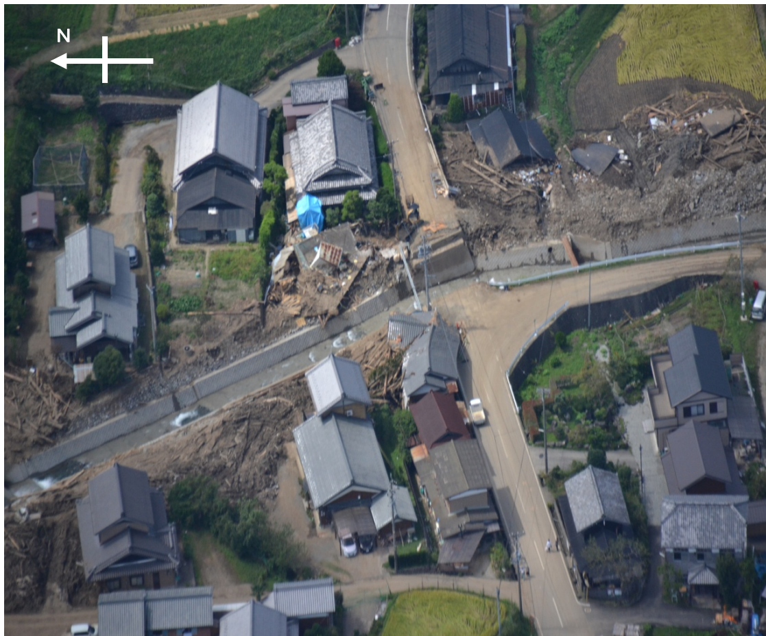
↑ 9月14日の状況（上空から撮影）