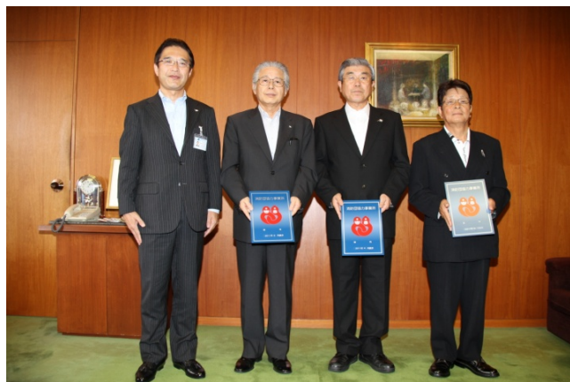
↑前業市長と表示証の交付を受けた協力事業所の代表者

消防団協力事業所とは、津市消防団員である従業員を有する事業所のうち、特に消防団員が活動