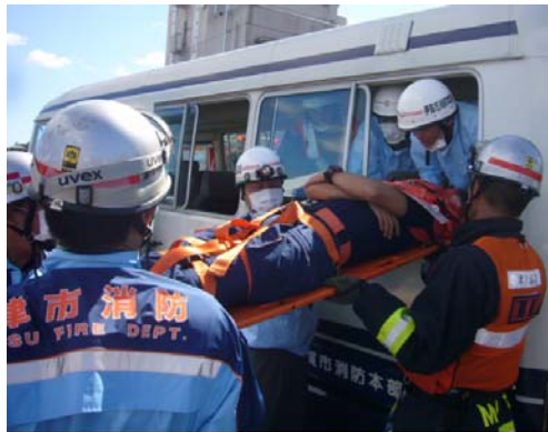
↑他の消防本部の隊員と連携し負傷者を救出する津市消防の隊員

今回の訓練は、マイクロバスと軽乗用車の衝突事故により、多数の負傷者が発生したとの想定のもと、他の消防本部と連携しながら、指揮隊活動及びブトリアージ（多数の傷病者を重症度などに応じ選別し、治療の優先度を決定する行為）要領に主眼を置いた実践的な訓練を行いました。