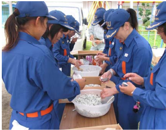
↑炊き出し訓練を行う女性消防団員

訓練の内容は、芸濃分署の隊員と芸濃方面団の団員の指導による消火器の取り扱い方法、応急担架による救出方法、三角巾などを使用した応急処置の方法や、煙発生器を使用した煙体験、起震車による地震体験などでした。また、消防団芸濃方面団の女性消防団員による炊き出し訓練なども行われました。 (服部真)