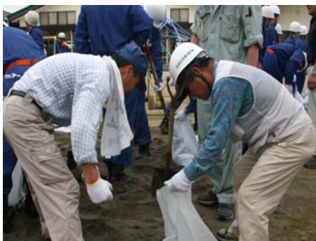
↑土のうを作る自主防災会

今回の訓練は、大型台風接近に伴い、堤防の一部が決壊する恐れがあるとの想定で、一志分署の隊員と一志方面団の団員の指導により、基本となる土のう作りから始まり、積み土のう工法、せき板工法を各グループに分かれて実施し、今後の本格的な台風シーズンに備え、水防工法技術を習得しました。 (松田高志)