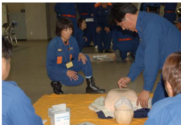
↑ 指導にあたる女性消防団員

講習の指導は、中消防署の隊員を中心として行いましたが、津方面団のデージー分団（女性のみの分団）の中には、応急手当普及員の資格を取得している団員もいることから、その団員らも指導を行いました。