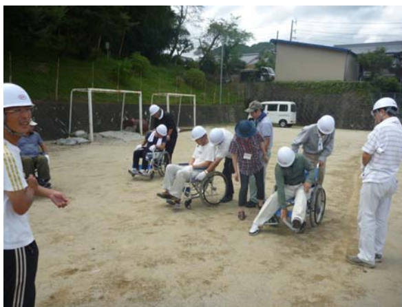
↑車いすの取り扱いの指導を受ける自主防災会

その他の訓練では、白山消防署の隊員と白山方面団の団員の指導により、水消火器を使用しての初期消火訓練、煙体験、応急担架作成・搬送要領(毛布・竹使用)、救急法、自衛隊及び白山方面団しらすぎ分団による炊き出し訓練が実施されました。 (市川功)