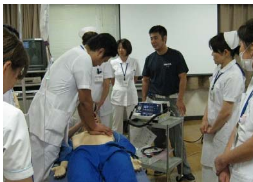
↑ 心臓マッサージの指導を受ける看護師

五月二十四日から四日間、看護師研修会が、市内の病院で開催されました。指導の依頼を受けた中消防署西分署の救急救命士を含む隊員が、看護師約二百人に対し、一次救命処置の実践的な指導を行いました。