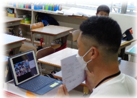
<タブレットを活用した学習>