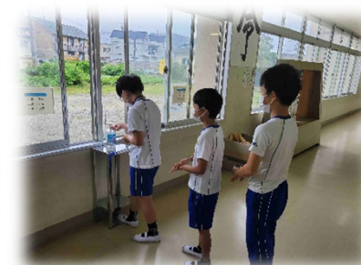
<国体中止に伴う物品の活用>