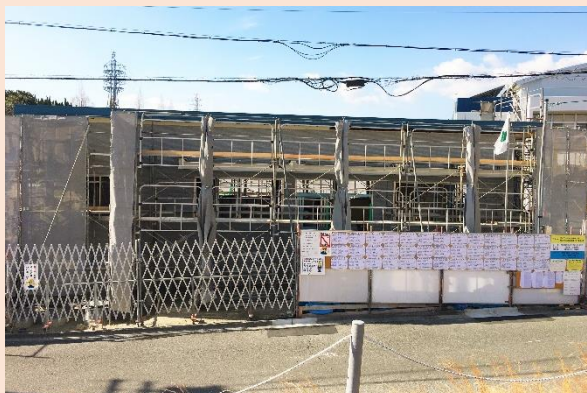
観音寺地区放課後児童クラブ 予算額66,359千円