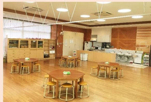
一志東地区放課後児童クラブ 予算額 19,861千円