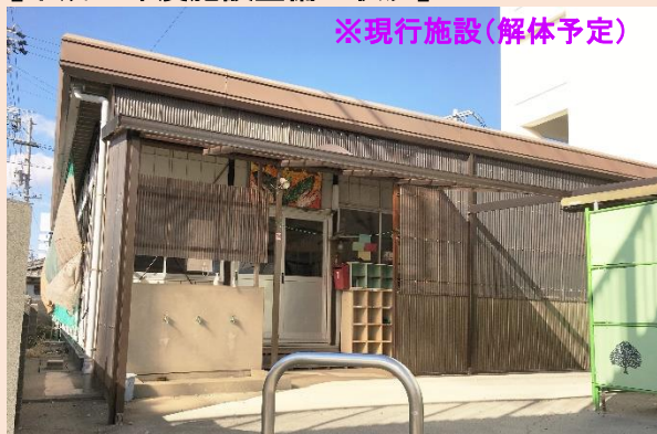
新町地区放課後児童クラブ 予算額33,620千円 (新町小学校の校舎内に整備中)