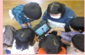
タブレットを活用した活動