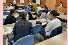
楽しく、実効性ある話し合い