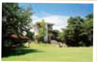
⑤ 伊勢上野城跡 (本城山青少年公園) 一帯は本城山青少年公園として整備され、憩いの場となっている。天守台跡に建てられた展望台からは、錦杖ヶ岳や経ヶ峰、天気の良い日には、中部国際空港も見渡すことができる。