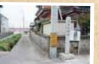
① 道路元標跡 旧上野村の道路元標(木製)があった場所に建っている。