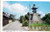
⑥ 窪田常夜燈 高さ約8.6mであり市内最大。文化14年(1817)建立。