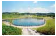
⑥ 中勢グリーンパーク 自然環境や広いスペースを生かした、人々が集い運動やイベントなどにも活用することができる芝生広場を中心とした総合公園。