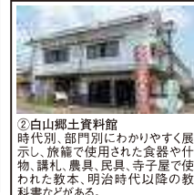
②白山郷土資料館 時代別、部門別にわかりやすく展示し、旅館で使用された食器や什物、講礼、農具、民具、寺子屋で使われた教本、明治時代以降の教科書などがある。