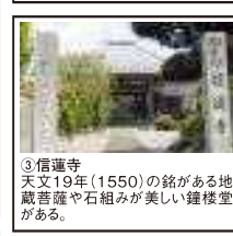
③信蓮寺 天文19年(1550)の銘がある地藏菩薩や石組みが美しい鐘楼堂がある。