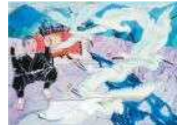
シラサギ伝説のイメージ