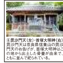
⑥毘沙門天(左)・首塚大明神(右) 毘沙門天は奈良県信貴山の毘沙門天のお告げが、首塚大明神はこの地から出土した骨壺が由来で、ともに並んで祀られている。