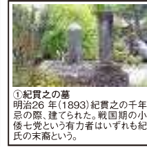
①紀貫之の墓 明治26年(1893)紀貫之の千年忌の際、建てられた。戦国期の小幡七党という有力者はいずれも紀氏の末裔という。