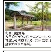
⑦白山運動場 多目的グラウンド、テニスコート、体育館から構成される。芝生広場は昼食おススメ場所。