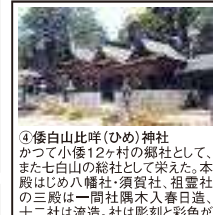
④倭白山比咩(ひめ)神社 かつて小倭12ヶ村の郷社として、また七白山の総社として栄えた。本殿はじめ八幡社・須賀社・祖霊社の三殿は一間社隅木入春日造、十二社は流造。社は彫刻と彩色が施され、江戸初期の様式をよく伝えている。