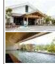
⑩猪の倉温泉 青山高原の麓に位置し、美肌に効果的な源泉かけ流しの温泉。宿泊や日帰り温泉と食事、アウトドアが楽しめる施設。