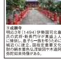
⑨成願寺 明応3年(1494)伊勢国司北畠氏の武将・新長門守が興盛上人に帰依し、息子ら一族を導くために城近くを建立。国指定重要文化財の楠木着色仏涅槃図や木造阿彌陀如来像がある。