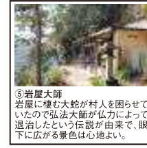
⑤岩屋大師 岩屋に棲む大蛇が村人を困らせていたので弘法大師が仏力によって退治したという伝説が由来で、眼下に広がる景色は心地よい。