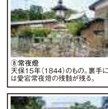
⑧常夜燈 天保15年(1844)のもの、裏手には愛宕常夜燈の残骸が残る。