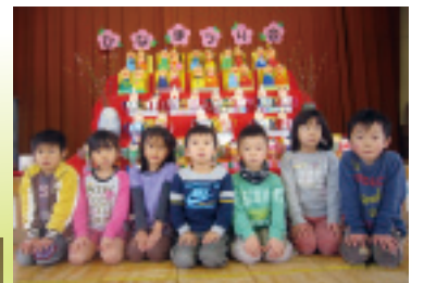
▲安西・雲林院幼稚園