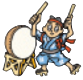
8月15日 雲林院地区盆踊り大会