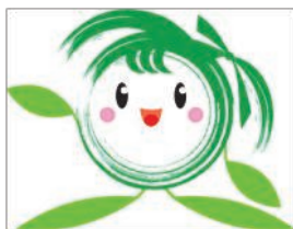
美里町PRキャラクター「ラブミー」