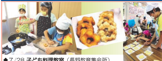
◆7/28 子ども料理教室（長野教育集会所）