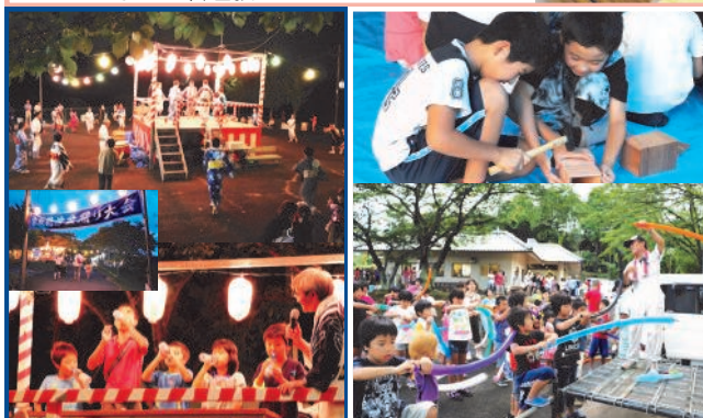
◆8/15 家所納涼盆踊り大会