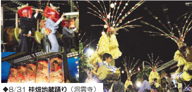
◆8/31 桂畑地藏踊り（洞雲寺）

津市ホームページ内の【地域情報】-【美里】のページでは、美里地域での行事などについて随時更新して掲載しています！