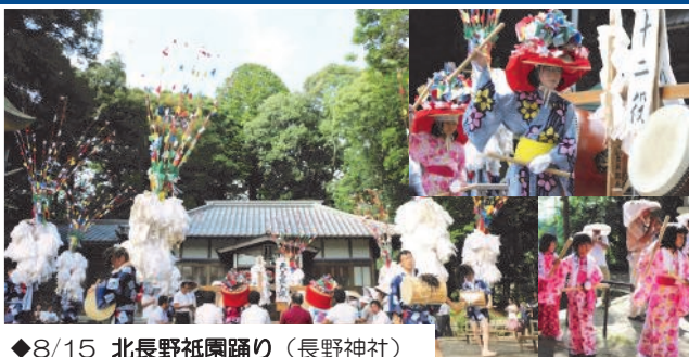
◆8/15 北長野祇園踊り（長野神社）