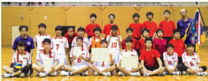
【男子バレー部】（敬称略）

【準優勝】第44回三重県中学生バレーボール選手権大会 女子の部（6月15日・16日） 【準優勝】津市中学校夏季総合体育大会（7月19日・20日） 【ベスト8】三重県中学校総合体育大会 第67回三重県中学校バレーボール大会（7月29日・30日）