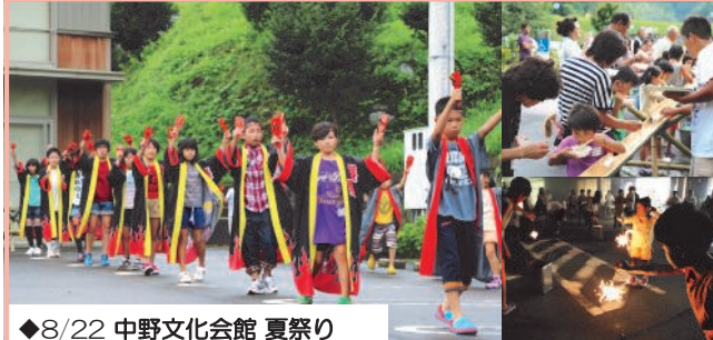
◆8/22 中野文化会館 夏祭り