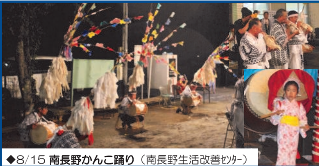
◆8/15 南長野かんこ踊り（南長野生活改善センター）