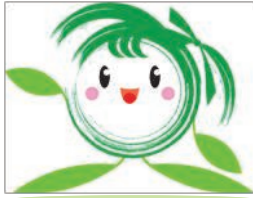
美里町PRキャラクター「ラブミー」