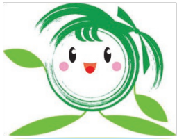
美里町PRキャラクター「ラフミー」