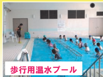
歩行用温水プール