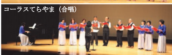
コーラスでらやま (合唱)