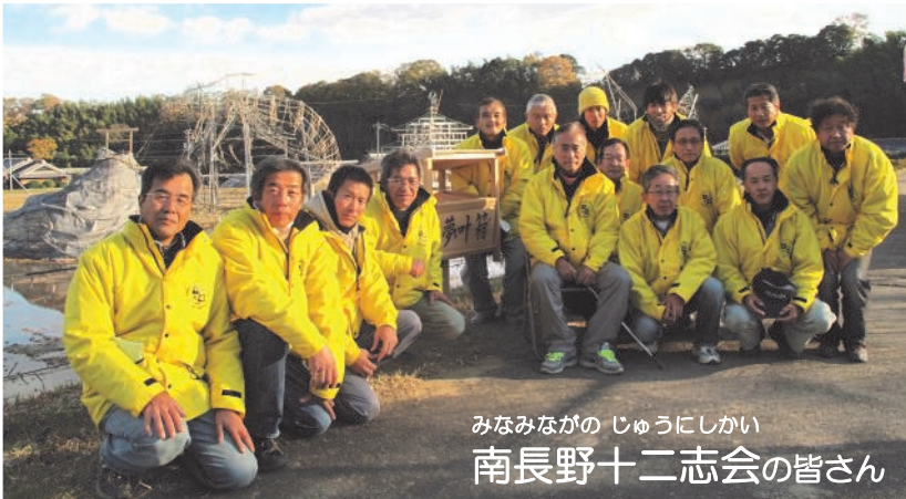
みなみながの じゅうじかい 南長野十二志会の皆さん

美里町内で様々な分野で活動している人を紹介します。今回は、冬のイルミネーション制作を手掛ける美里地域の地域活性化ボランティアグループ「南長野十二志会」の皆さんを訪ねてお話を伺いました。