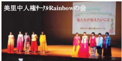
美里中人権サークルRainbowの会