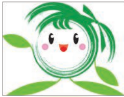
美里町PRキャラクター「ラブミー」