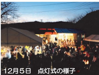
12月5日 点灯式の様子

私たち「南長野十二志会」は、今回のイルミネーションのテーマを「伊勢志摩サミット日本のおもてなし」と題して、2016年5月三重県志摩市で開催の先進国首脳会議「伊勢志摩サミット」を歓迎したいと思いました。メインのオブジェは、伊勢志摩の味覚の王様「伊勢エビ」と名勝地「夫婦岩」でPRします。これらを新たに制作するに当たり、骨格となる部分に 地元の竹を100本 ほど使いました。これまでのオブジェの中で 最大級 です。ぜひ現地でご覧ください。