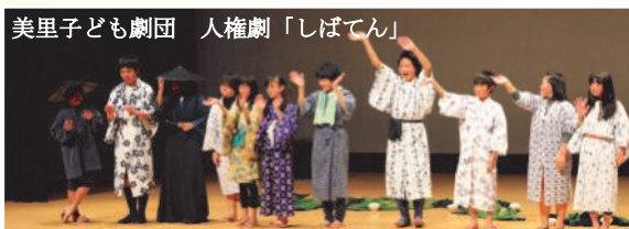
美里子ども劇団 人権劇「しばてん」