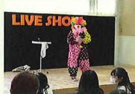
前回のたつみずフェスタの様子