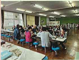
朝ごはんや高宮の様子