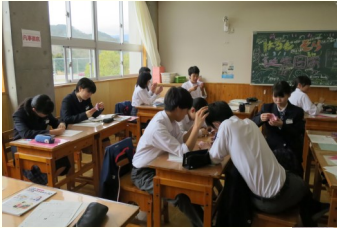
かけがえのない 仲間たち

みさとの丘学園をご卒業された皆さん、学園で学んだことを胸に 大きな夢と希望をもって、それぞれの道で活躍してください。