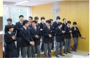
お世話になった 先生方