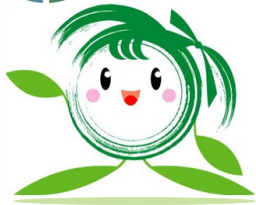
美里町PRキャラクター「ラブミー」