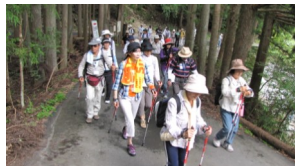
ノルディックウォーキングの様子

また、セラピストによる「リラクゼーション体験」も行われ、森の楽しみ方も紹介されました。