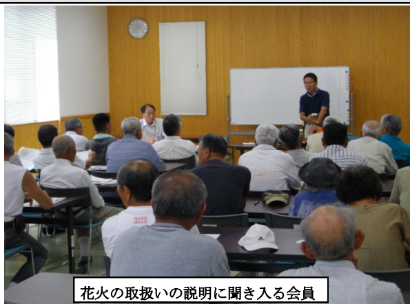
花火の取扱いの説明に聞き入る会員

有害獣を追い払うための花火やパチンコ、電動エアガンなどの資材を購入し、会員がそれぞれで工夫をしながらその効果を確認してきました。それぞれの資材にそれなりの効果はあったものの、課題も見つかったと言います。高齢者や女性が取扱うには問題の多い資材や、威力が小さかったり、使用できる場所が限られるものもありました。