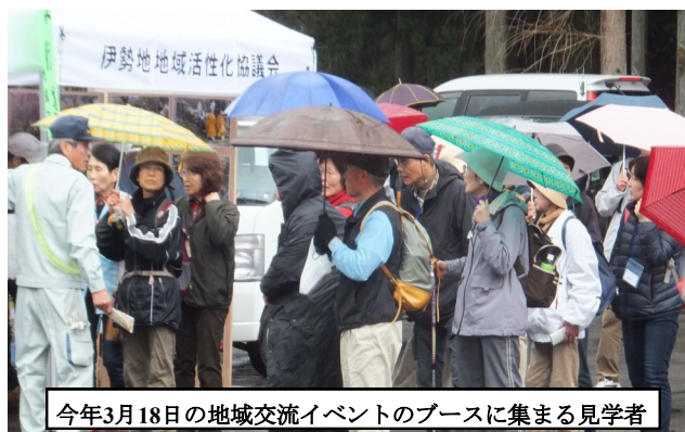
今年3月18日の地域交流イベントのブースに集まる見学者

いくつかのテーマを選び分科会をつくらうという意見もありましたが、分散を避けて、地域で一番の関心事にみんなで取り組みたいということから、ワークショップでのアンケートで最も関心の高かった「獣害対策」にテーマを絞り、平成22年11月に、85人の会員で設立されました。