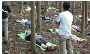
リラクゼーション体験の様子