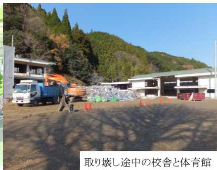
取り壊し途中の校舎と体育館