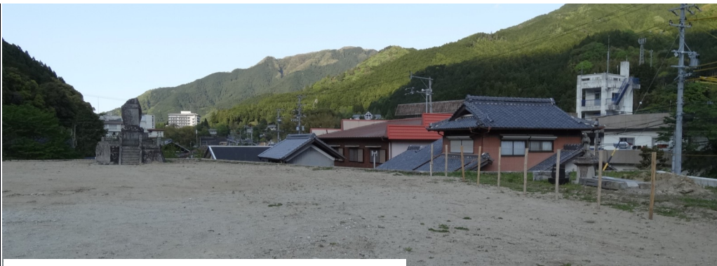
(仮)津市美杉総合文化センターの建設を待つ旧小学校跡地

いよいよ、旧美杉東小学校の跡地に(仮称)津市美杉総合文化センターの建設が始まります。そこで、「美杉村史」と「美杉村(50周年記念誌)」により、跡地の歴史を振り返ってみました。