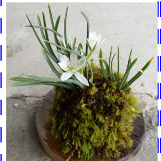
今年も花をつけた苔玉

大切に守ってきた甲斐があつて、今年も3回目の花を咲かせてくれました。めちゃ嬉しいです。