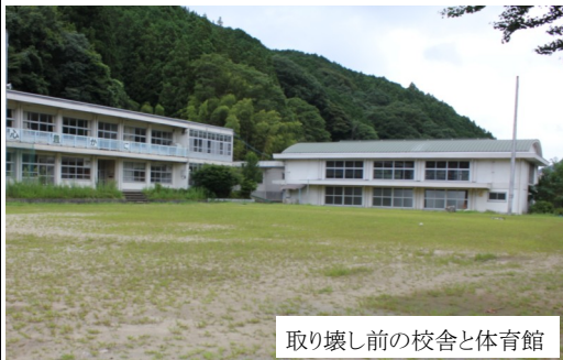
取り壊し前の校舎と体育館

平成10年に、竹原小学校と八知小学校が統合され、美杉東小学校として出発します。平成18年には合併によって津市立となり、平成22年まで続きますが、美杉小学校への統合により、美杉東小学校は廃校となりました。そしてこの地は、昨年度の解体工事により現在の跡地となりました。