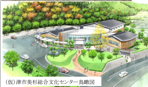
(仮)津市美杉総合文化センター鳥瞰図