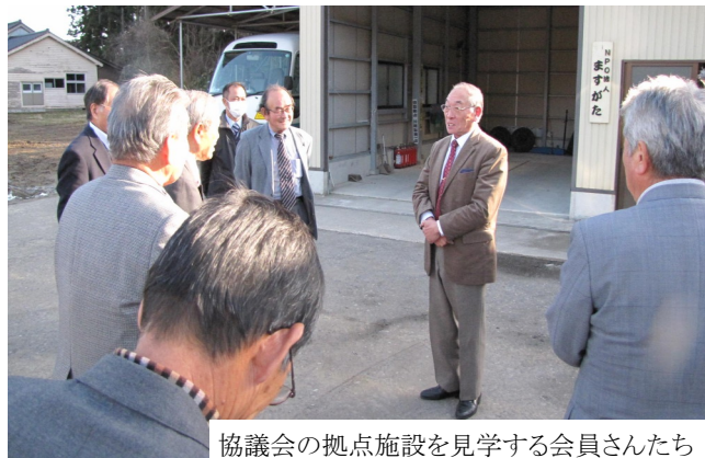
協議会の拠点施設を見学する会員さんたち

八代地域の自主運行バスについては、利用者の個人負担が大きく、視察に参加された役員さん方からは、これだけの負担は美杉では重過ぎるという感想も聞かれましたが、まねをする必要はありません。美杉には美杉なりの運行形態や負担の仕方があるはずで